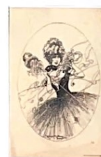
femme costumée (carte) xx ème Siècle