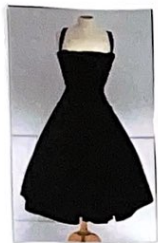
Société Seneine 1955