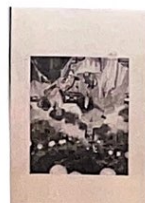
fête nocturne (estampe)