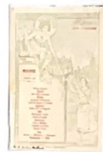
Musique / municipal (menu) 1908

"Nuit penchée au-dessus des villes et des eaux, Toi qui regardes l'homme avec tes yeux d'étoiles, Vois mon cœur bondissant, ivre comme un bateau (...)" (Anna de Noailles)