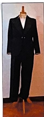
Costume, Smoking xx ème Siècle